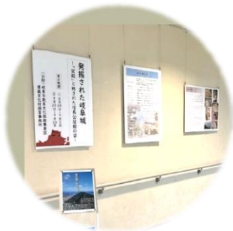
▲パネル展示の様子