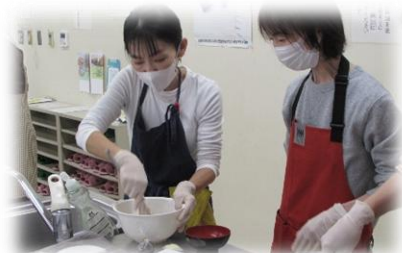
【こねずに！ 初心者さんのラクラクぱん作り！】