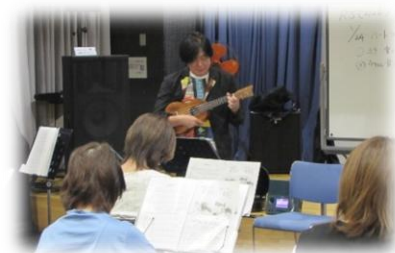
【みんなで楽しむ、やさしいウクレレ♪】