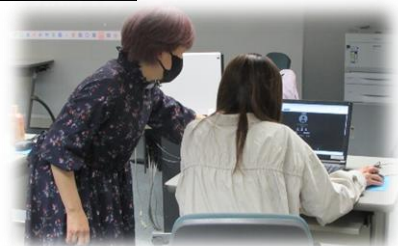
【初めてのAIアート講座】