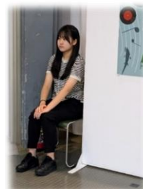
▲ボランティアの活動風景