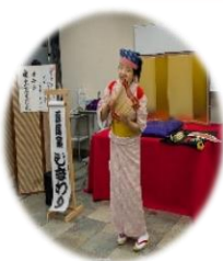
▲落語と南京玉すだれを披露