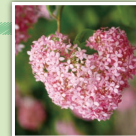
ハートの形の植物