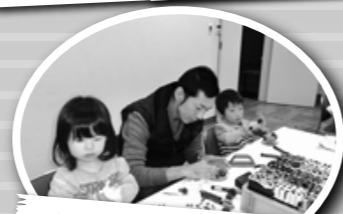
木の葉のメモスタンド