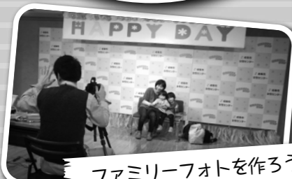
ファミリーフォトを作ろう