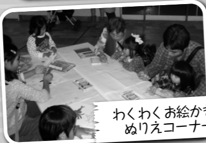
わくわくお絵かき・ ぬりえコーナー