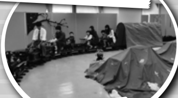
岐阜県立岐阜工業高等学校 ミニSLに乗ろう!!