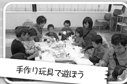
手作り玩具で遊ぼう