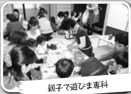
親子で遊びま専科