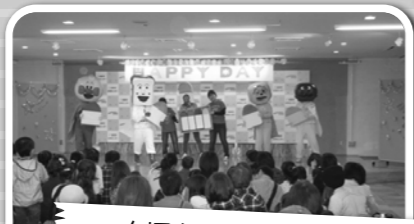
大垣女子短大生による 人気キャラクターショー