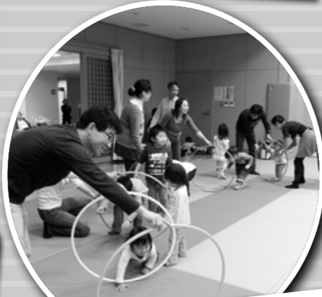
わくわく親子たいそう