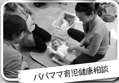
パパママ育児健康相談