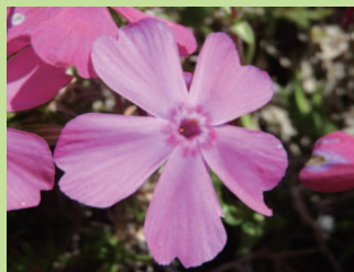
サクラの花に似ているかな？