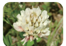
シロツメクサの花（上）・葉（下）

江戸時代に外国から日本にガラス品を運ぶとき、ガラスが壊れないよう、乾燥させたシロツメクサが箱に詰められていたことから名付けられました。ハナツメクサ（花爪草）とシロツメクサ（白詰草）は名前こそ似ていますが、「ツメ」の漢字が異なるように、まったく別の種類の植物です。