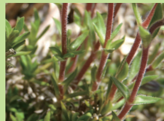
爪のようにとがった形の葉