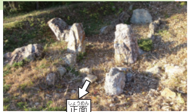
写真：大廻古墳2号墳

1号墳はわずかな石があっただけだったことから、土を掘って調査をした後、また土の中に埋め戻されてしまいました。この調査は45年以上も前のことで、いま今となってはどこにあったのかさえ分かりません。