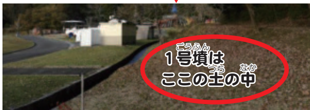
1号墳はこの主の中