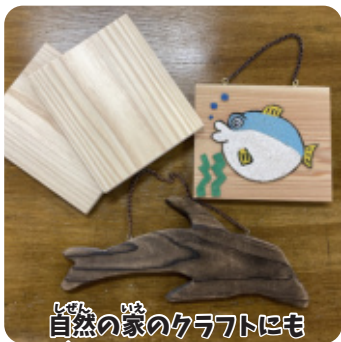
自然の家のクラブにも使われているよ！

漢字で書くと「杉」ですが、まっすぐな木の意味の「直木（すき、すくき）」から、「杉（すぎ）」になったといわれています。まっすぐで加工がしやすい木材なので、家具や建築材としてよく使われます。