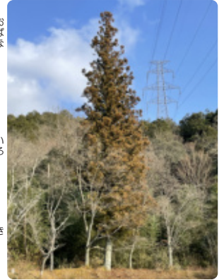
場所は自然の家キャンプ場付近