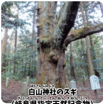
白山神社のスギ (岐阜県指定天然記念物)

スギは長生きの木で、災害などがなければ500年以上生きられます。屋久島で有名な「縄文杉」は、樹齢2500年以上といわれています。