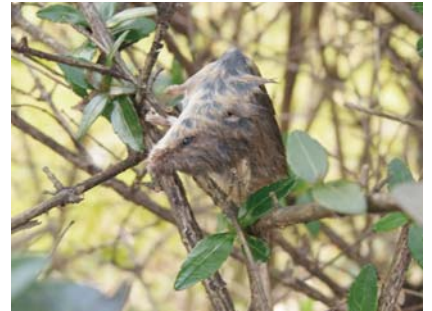
写真：モズのはやにえ (ネズミ)

今回は、自然の家周辺で見つけた「モズのはやにえ」の種類と見つけやすい場所を紹介したいと思います。