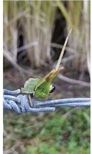
ショウリョウバッタの頭 あたま