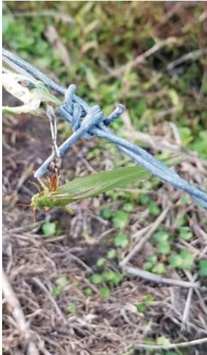
サトクダマキモドキ