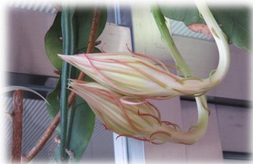
つぼみ（9月9日19時ごろ）

高さは3メートルくらいに成長し、直径20センチくらいの白い華麗な花を深夜に咲かせ、朝には、しぼんでしまいます。「一夜かぎりの月の下に咲く、美人のようなきれいな花」ということから、この名前が付いたのではないのでしょうか。