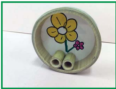
おきあがりごぼし