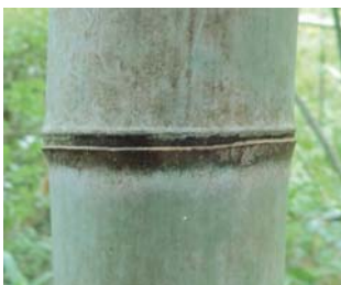
マダケ 節の線が2本

一般に国内だけで約600種類、世界には約1200種類があると言われる竹。自然の家周辺でもいろいろな種類の竹が見られますが、上の作品では、マダケ、モウソウチク、メダケ、シホウチクの4種類を使っています。