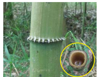
シホウチク 莖（稈）が四角