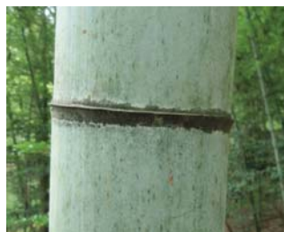
モウソウチク 節の線が1本