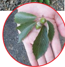
ハイロチョッキリ