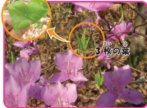
コバノミツバツツジ

これは、「コバノミツバツツジ」というツツジです。ツツジの中で、どの種類よりも早く咲き始めるので「一番ツツジ」と呼ぶところもあるそうです。