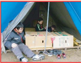
ダンボールや新聞紙で寒さ対策！

テントをついたら、あたたかくなる工夫をしよう♪(^o^) テントが出来た時には、出会ったばかりの子とも仲良し！