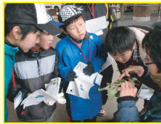
アオスジアゲハの蛹の観察

冬の自然見つけ！服を着ていない生き物たちは、寒い冬にどんな工夫をしているのかな？(?!)