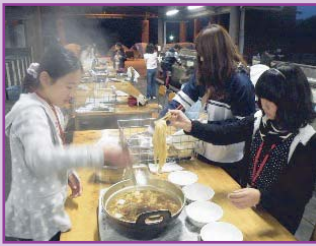
ホカホカ煮こみラーメン

夜は気温がマイナスに!!(>_<) みんなで作ったご飯で体も心もあったかく!(^_^)