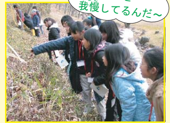
カマキリの卵探し

冬の自然見つけ！服を着ていない生き物たちは、寒い冬にどんな工夫をしているのかな？(?!)