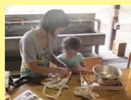
模様が決まったら作業開始！

親子で模様の見本を選んでから、相談して作業しました。輪ゴムの止め方、布の折り方など様々な工夫しました。