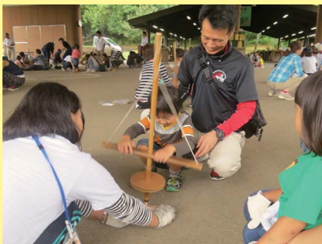
家族みんなで協力して火おこし！

この事業は、日帰りで気軽に自然体験活動を楽しんでいただくことを企画したもので、火おこし、野外炊事、クラフト活動を行いました。両日あわせて、四十一家族、百四十七名のみなさんが参加しました。