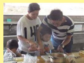
手を添える家族の姿が微笑ましい！