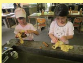
少しづつ広げながら…ドキドキ！

しっかりと色がでるか？模様はできているかな？と不安そうにお鍋の中を覗き込む親子の姿が見られました。