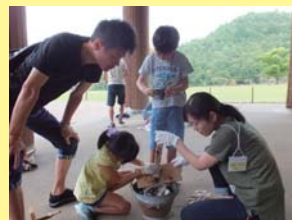
火だねをそおと新聞紙へ！