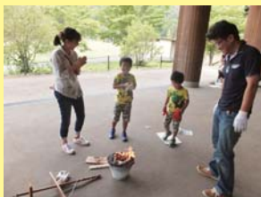
どの家族も皆さん火おこしに成功しました！

火おこし活動では、家族が声をかけ合いながら、活動する姿が見られました。おきた火を見て大人も子どもも目を輝かせながら、大きな歓声をあげた姿が印象的でした。みんなで協力して、すべての家族が無事に火をおこすことができました。