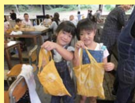
上手に模様が作れたね！

色の着いたバッグに模様がきれいに浮き上がった作品を手に、みなさん笑みが溢れていました。