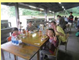
みんなとっても美味しそう！