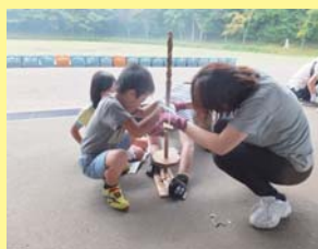
親子で協力しました！