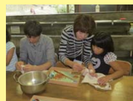
お母さんと協力して作品作り！

しっかりと色がでるか？模様はできているかな？と不安そうにお鍋の中を覗き込む親子の姿が見られました。