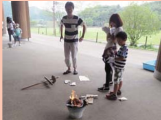
見事！火おこし成功だ！

火おこし活動では、家族が声をかけ合いな がら、活動する姿が見られました。ついた火 を見て大人も子どもも目を輝かせながら、大 きな歓声をあげている姿が印象的でした。 みんなで協力して、すべての家族が無事に 火をおこすことが出来ました。