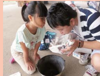
またまた、親子で協力！