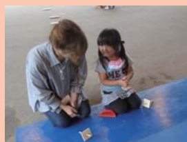
お母さんに コマの回し方を教えてもらえたね！