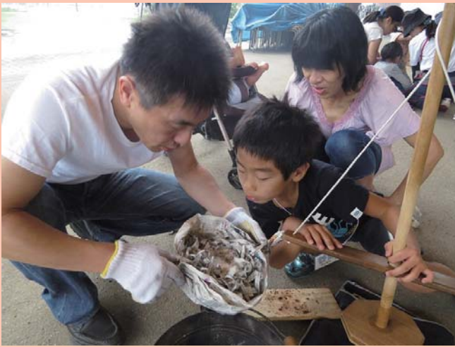
家族みんなで協力だ！

9月6日(日)、13日(日)【同一内容】 岐阜市山県北野の岐阜ファミリーパークで「フ ァミリーDAY」火起こしに挑戦！野外炊事編」 を開催しました。この催しは、日帰りで気軽に 自然体験活動を楽しんでいただくとう企画した もので、火おこし、野外炊事、工作を行いました 。両日あわせて44家族166名の参加があ り、家族で大いにぎわいました。