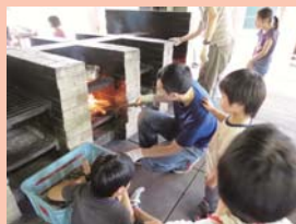
火の調節を頑張る、お父さんの姿 がよく見られました！

子どもと一緒に水を量ったり、かまどに火 をおこしたりと、親子で笑い合い、助け合い ながら調理する姿が印象的でした。