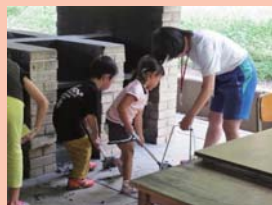
後片付けもみんなで頑張りました！