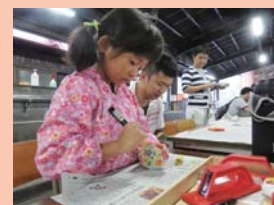
可愛いデザインのコマだね！