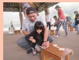
使い慣れない道具も お父さんがいれば安心だね！

また、親子で真剣にコマのデザインを考え ている姿に微笑ましさを感じました。 大人も子どもも一緒に楽しみむことがで きる活動となりました。