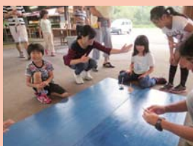
みんなでコマを回して楽しかったね！