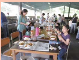
美味しいカレーが完成です！