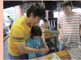
手を添える家族の姿が微笑ましい！

子どもと一緒に水を量ったり、かまどに火 をおこしたりと、親子で笑い合い、助け合い ながら調理する姿が印象的でした。