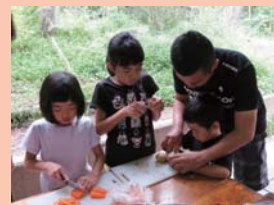
家族みんなで野菜を切りました。