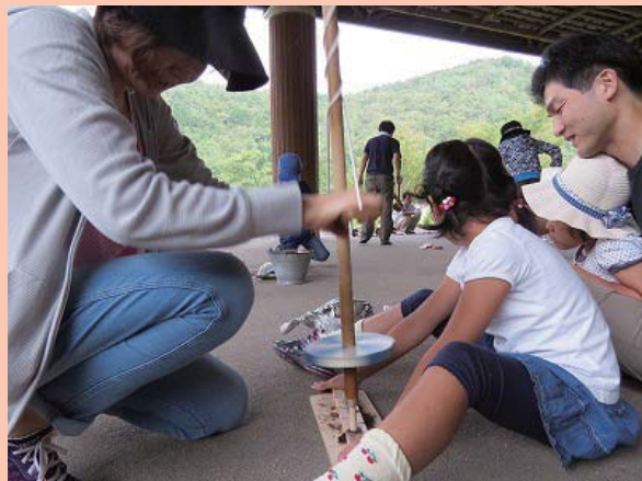
「ファミリアDAY」火おこしに挑戦！野外炊事編」昨年度の様子

参加した家族からは、「何気なく見過ごしてきた草花をじっくり見直すことができました。」「草花を使っていたいろいろな遊びができて親子とも楽しかったです。」など、たくさんうれしいご意見をいただきました。次回のファミリアDAYは、9月6日(日)と、13日(日)に「ファミリアDAY」火おこしに挑戦！野外炊事編」を予定しております。火おこしでおこした火を使って、お風呂飯を作ります。皆さんの参加をお待ちしております。