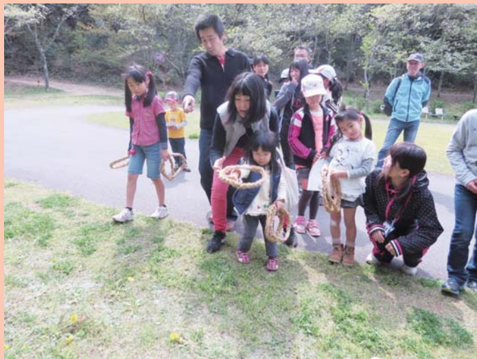
タンポポの輪投げゲーム！

この催しは、「今日を、家族の自然体験記念日にしませんか？」をテーマに、春の自然を味わいながら、クイズやゲームに挑戦する、日帰りの活動です。