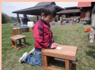
一生懸命になって色塗りをしたよ！