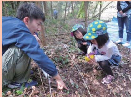
不思議な形のお花だね！

岐阜ファミリアパークでは、食草の1つ「ヒメカンアオイ」を見ることが出来ます。この植物は、だいたい3月の下旬頃から花を咲かせるのですが、タンポポやスミシシなどの花と比べて、大きく姿が異なります。地面をよく見てみると、濃い紫色をした壺のような形の花(写真)が顔を出すように咲いています。3つに分かれている部分は「がく片」といい、花びらは退化してありません。子どもたちは、「えっ！これが、花なの？」と所員に訪ねていました。