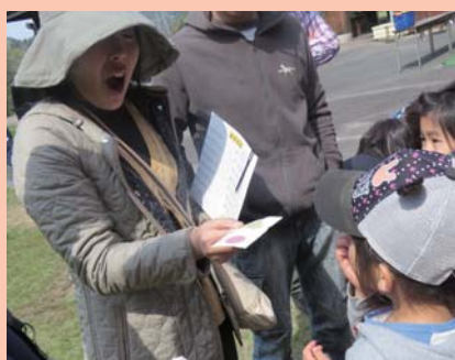
三色団子の完成にお母さんもビックリ！