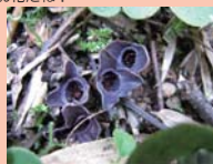
ヒメカンアオイの花