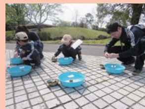
家族のみんなで真剣勝負！

メタセコイアの実を使って遊びました。たくさん落ちている実を拾って、ぐらぐらゲームに挑戦です。安定しない台の上にくっつた実を乗せることができるでしょうか！制限時間を決めて家族内で対戦です！大人も子どもに負けず劣らずの真剣な顔つきで楽しんでいました。