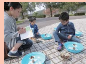
結果を取りまとめるのは、お母さん！