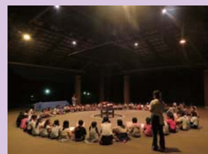
キャンプファイヤーは歌でしめくくり