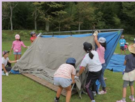
「みんなで息をあわせて！せーのっ！」