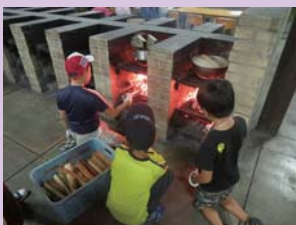
みんなの火を扱う姿はたのしい！！