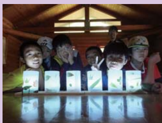
完成！素敵な【葉っぱシェード】ができたね♪

大きい葉や小さい葉、虫に喰われた葉など思い思いの葉を使い個性あふれる素敵な土産となりました。