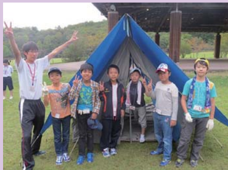
「やったー！完成だー！」