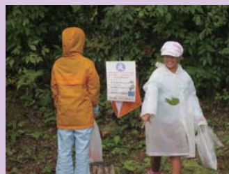
「どれが正解かなー？」