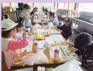
思い思いの葉っぱを使って集中しています！