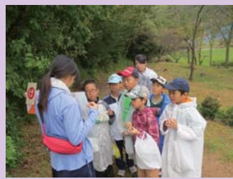
「みんな秋の七草、言えるかなー？」