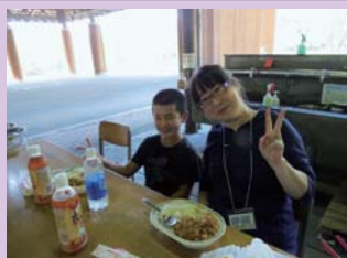
美味しそうナカレーができたね！

多少やわらかかったり、焦げたりしたご飯もあつたけれど、どの家族も美味しく食べることができました。