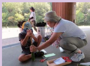
使い慣れない道具もお母さんがいれば安心だね！