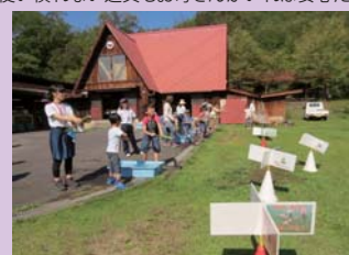
的めがけて練習開始！