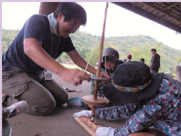
さあ！火起こしに挑戦だ！

この事業は、日帰りで気軽に自然体験活動を家族で楽しんでいただくことと企画されたもので、今回は「家族で協力して火をおこし、野外炊事をしませんか？」というテーマで開催しました。残暑厳しい中でしたが、両日あわせて47家族152名の方に活動を楽しんでもらいました。