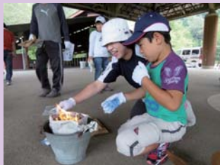
お見事！火起こし成功だ！