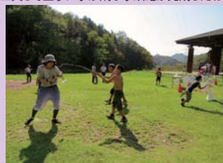
水のかけ合いが始まってしまいました(笑)