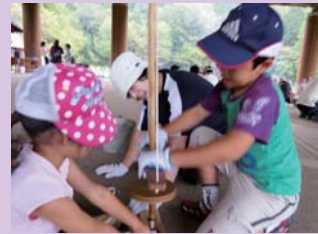
みんな汗だくで頑張ってたね！

家族で協力しながら一生懸命火をおこそうとする姿や、ついた火に「わーっ！」と目を輝かせる子どもたちの姿が印象的でした。無事にどの家族も火をおこすことが出来ました。