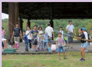
工夫して上手に水が飛ぶ水鉄砲が完成したね！

散策後は今回のファミリーDAYの記念にお土産作りを行いました。今回のお土産は、竹を利用して水鉄砲を作りました。遠くまで飛ぶ水鉄砲を作ろうと、親子で話し合いながら工夫を重ねている姿が印象に残りました。