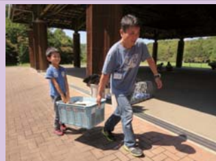
薪かごをもっていざ炊事場へ！

お昼ご飯は、薪に火をつけ、飯ごうでご飯を炊き、ウインナーカレーを作りました。慣れない手つきで包丁を使う子どもを、温かい目で見守っている母親の姿や、子どもと一緒にかまどに火をおこす父親の姿を見ることが出来ました。