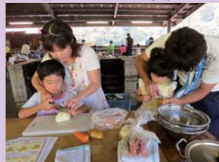
親子で野菜切りに挑戦だ！

多少やわらかかったり、焦げたりしたご飯もあつたけれど、どの家族も美味しく食べることができました。