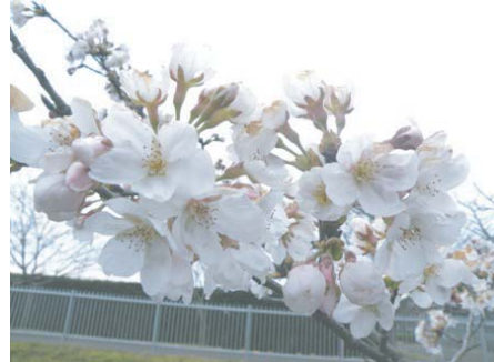
自然の家辺りの桜 (H22. 3. 31撮影)

しんねんど むか がつ がっこう ていぼう こうえん い さくら はな さ みだ 新年度を迎える4月、学校や堤防や公園に行くと桜の花が咲き乱れて いることだと思います。昔から日本人を楽しませてくれる桜、でも一口 さくら おも むかし にほんじん たの さくら ひとくち に桜と言っても、実はたくさんの種類があることを知っていましたか？ こんかい しぜん いえ み 今回の自然の家だよりでは、ファミリーパークで見ることができる色 いろ さくら しょうかい おも まわ おな さくら み 々な桜を紹介したいと思います！みなさんの周りでは、同じ桜を見るこ とができるかな？