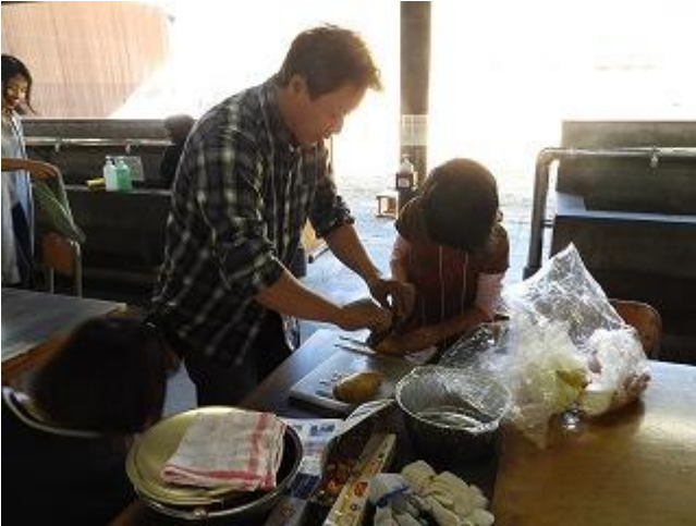
じゃがいもに切り込みを入れます。