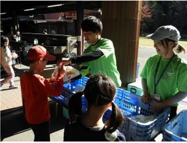
材料を受取ったら・・・