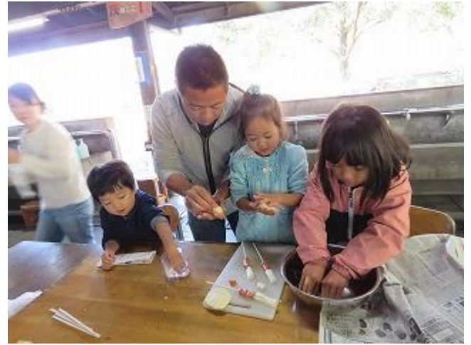
生地をチーズとウィンナーに巻き付けます。