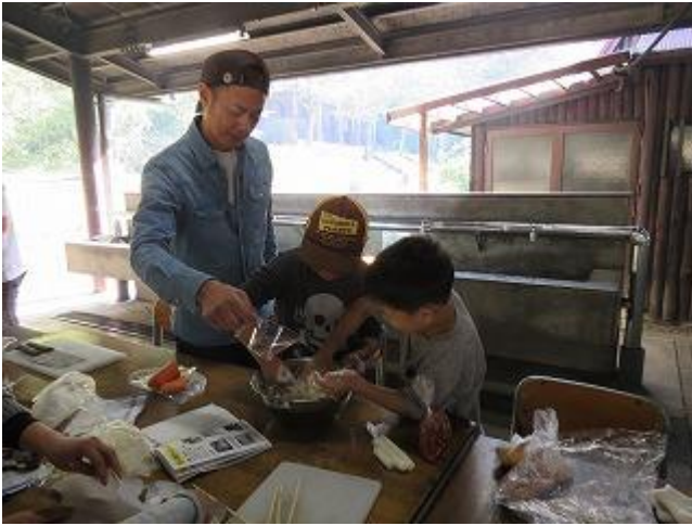
次に、チーズびーよーんパンの生地をこねます。