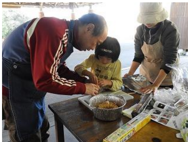
切り込みを入れたら、ベーコンを挟みます。