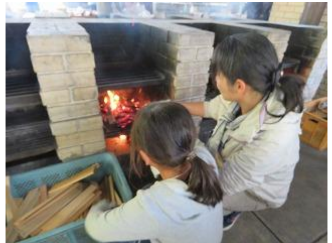
火加減は良いかな？