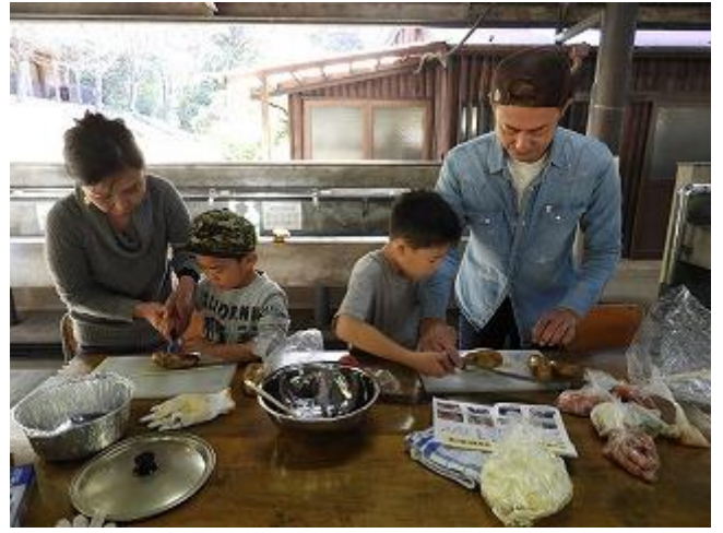
まずは、ハッセルバックポテトの準備