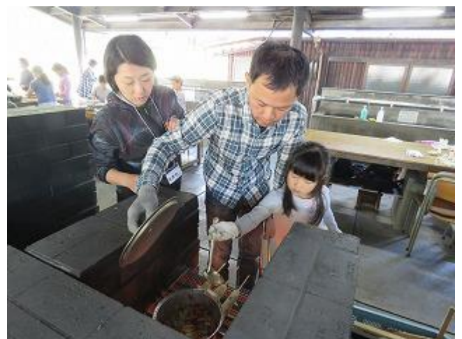
スープの加減はどうかかな？