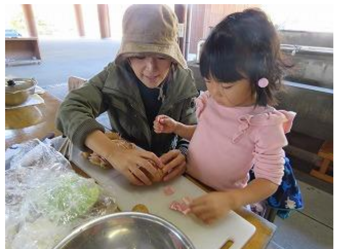
ひとりでは難しい作業も、家族で協力すれば大丈夫！