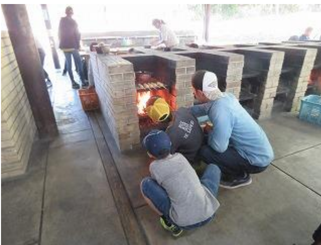
うまく焼けるかな？