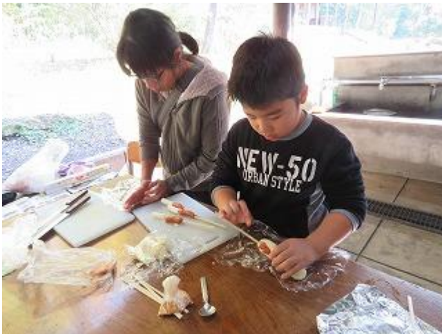
チーズがこぼれないようにしっかり生地をくっつけてね。