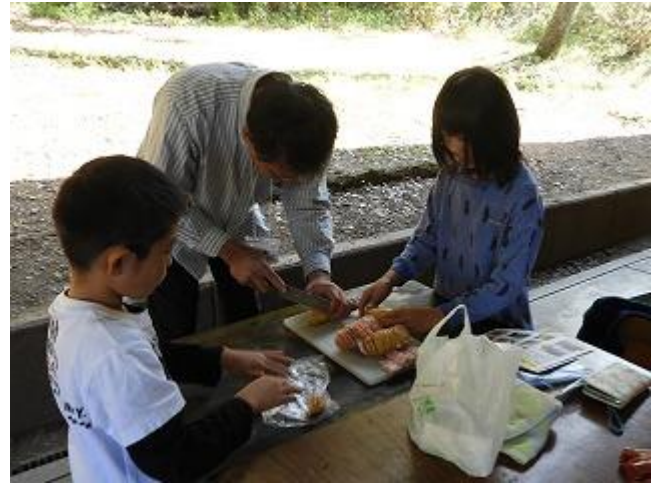
切り落としてしまわないように、割りばしを置くといいよ。