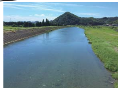
当日の活動場所：武儀川（岐阜県関市）