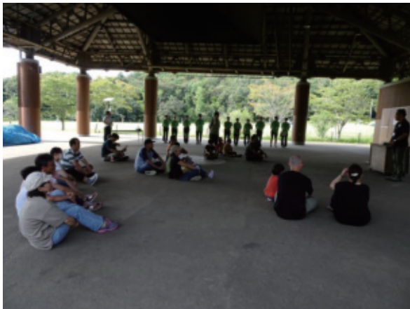
ファミリーキャンプの始まりです。