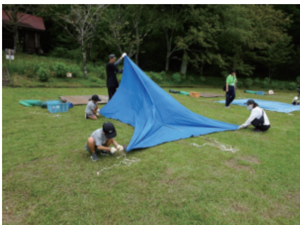
家族で役割分担。「角のペグ打ちをお願いね。」声を掛け合って作業を進めます。