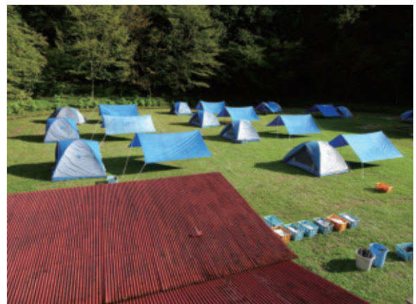
無事、設営終了です。家族の拠点が出来ました。やったね！