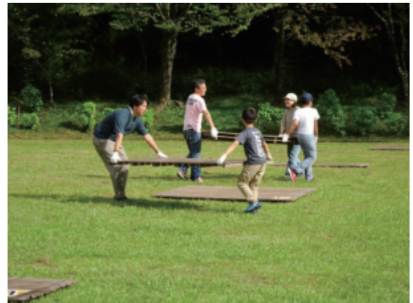
はじめの活動は、テント・タープ設営。重たいスノコを協力して運びます。