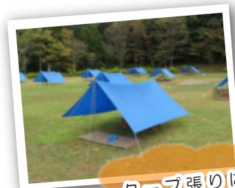
タープ張りに挑戦!