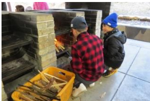
野菜を切る係やかまどの火加減を調節する係など、役割を分担して調理しました。