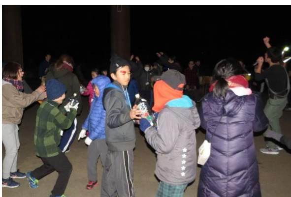
盛り上がってきたところで、みんなで歌や、じゃんけんゲームを楽しみました。