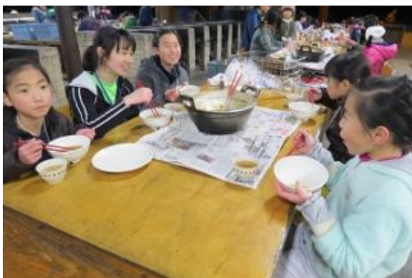
それぞれの班特製の煮込みラーメンが完成しました。班でそろって「いただきます！」