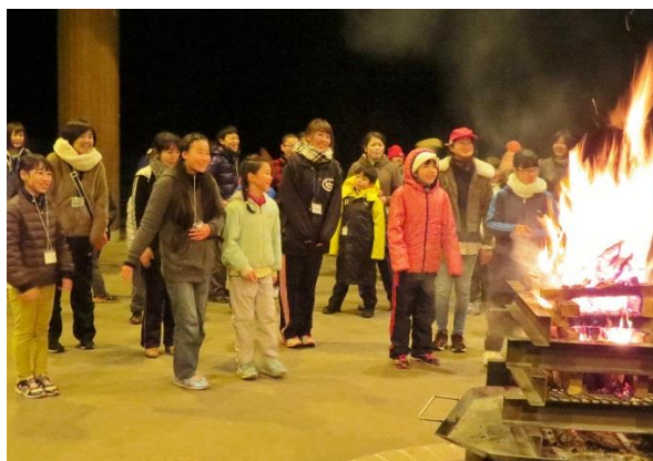
火が激しく燃え上がると、みんなの気分も一気に盛り上がってきました。