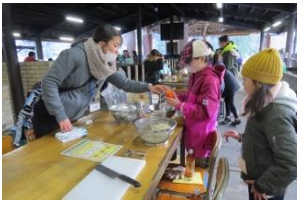
大学生のボランティアからアドバイスを受けながら、一緒に野外炊事をしました。