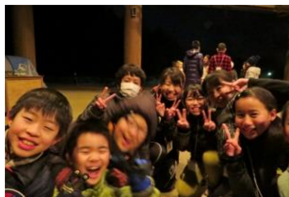
寒さを忘れてみんなで盛り上がりました。