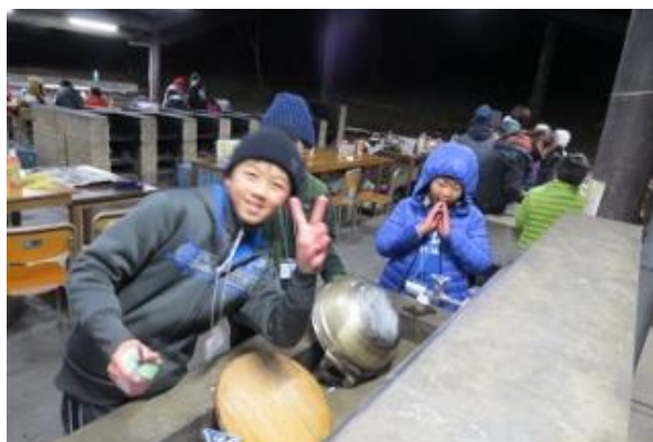
みんなで協力して後片付けをしました。寒い中、みんなよくがんばりました。