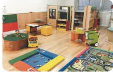
ふれあいルーム ままごとや魚つりなどを楽しむことができます。