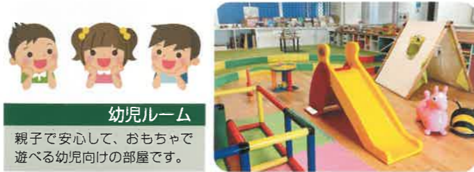
幼児ルーム 親子で安心して、おもちゃで遊べる幼児向けの部屋です。