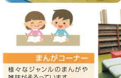
まんがコーナー 様々なジャンルのまんがや雑誌がそろっています。