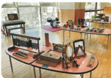
楽器コーナー めずらしい楽器やミニドラムなどいろいろな種類の楽器がそろっています。