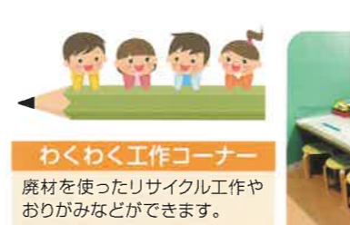
わくわく工作コーナー 廃材を使ったリサイクル工作やおりがみなどができます。自由な発想で楽しめます。