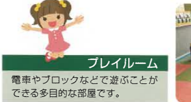
ブレイルーム 電車やブロックなどで遊ぶことができる多目的な部屋です。