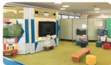
ゲームコーナー テレビゲームやエアホッケーなどが楽しめます。