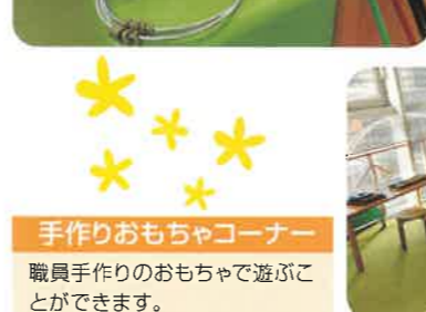
手作りおもちゃコーナー 職員手作りのおもちゃで遊ぶことができます。