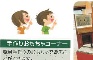
手作りおもちゃコーナー 職員手作りのおもちゃで遊ぶことができます。