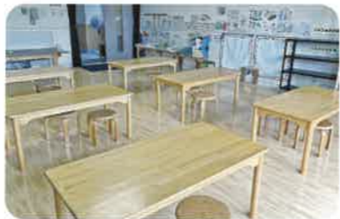
なかよしルーム 絵の具やクレヨンでお絵描きを楽しめます。日曜日は月替わりのものづくり体験ができます。 ※メニューの詳細はお問い合わせください。