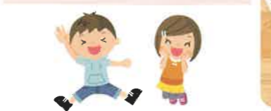
ドリーム ホットスペース 静かにゆったり過ごすことができます。