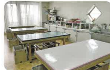
クラフトルーム 土・日・祝日は、木っ端やタイルを使ったえんぴつたてやキーホルダーなどのものづくり体験ができます。 (小学生以上対象) ※毎月第3日曜日はお休みです。