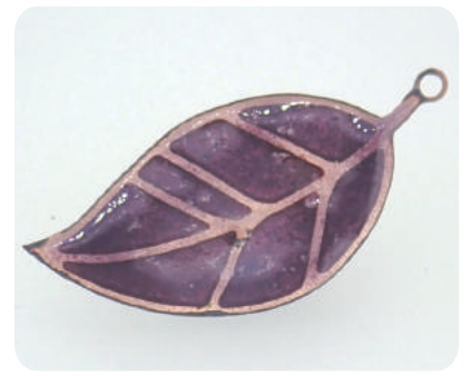
職人から学ぶ！貴金属装身具 七宝焼きのペンダントトップの作品例

職人から学ぶ！貴金属装身具 アクセサリーなどを作る職人さんから、七宝焼きの絵付けの方法・焼き方を学ぶよ！